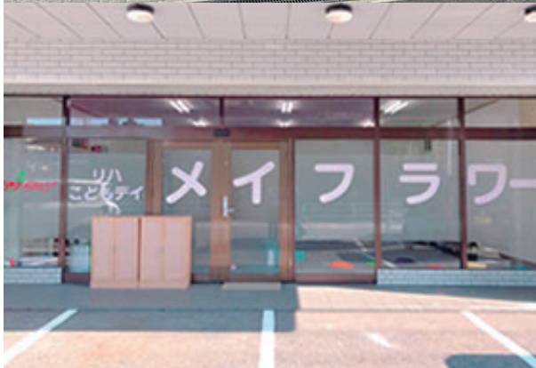
リハこどもデイアイビー