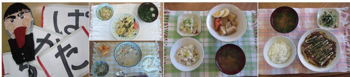
▲食事は施設内厨房で調理しているため温かく、また、ご希望に合わせた食事形態でのご提供も可能です▲

▼創作活動や趣味活動は、手先を使った脳トレーニングとしての目的だけでなく、出来上がった時の喜びや達成感を感じて、心と体の健康を改善していくリハビリの一つです