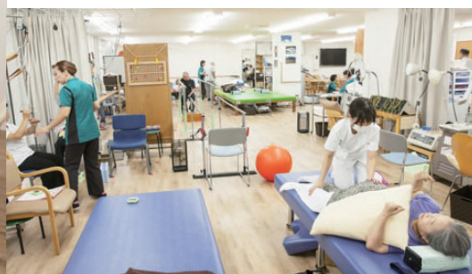
訪問リハビリテーション