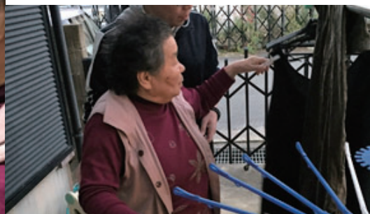
通所リハビリテーション