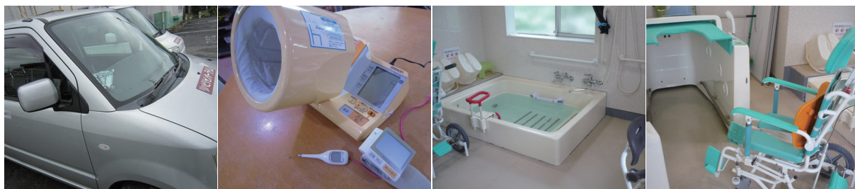
▲当日の体調チェックもしっかりと